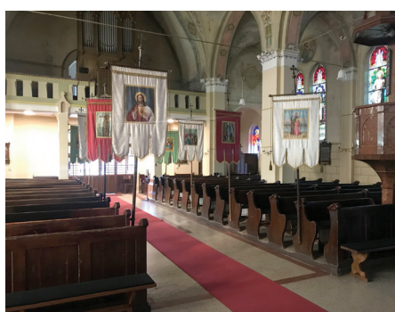
Az Úrnapi feldíszített templom