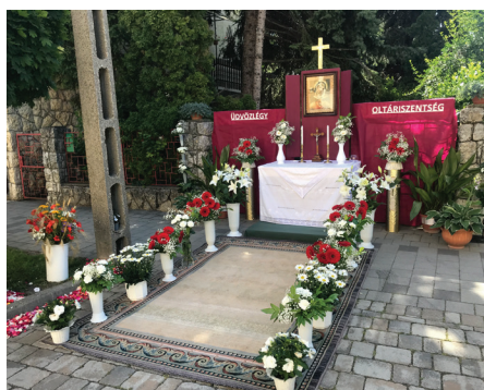
Öry, Fazekas, Máté család